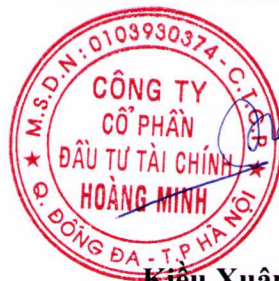
Kiều Xuân Nam